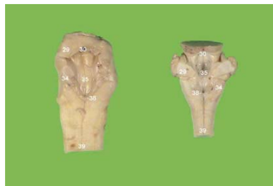
Dorsaal aanzicht van de hersenstam van een rund (links) en een schaap (rechts)