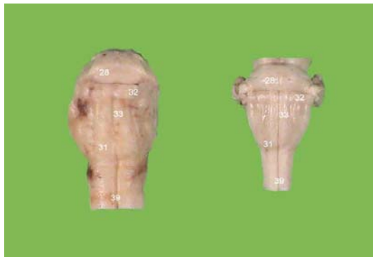
Ventraal aanzicht van de hersenstam van een rund (links) en een schaap (rechts)